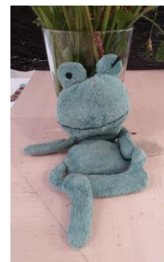
Ik zou graag naar huis willen... Wie komt mij ophalen?

Het vakantierooster is op dit moment nog niet klaar. De bedoeling is dat in de komende Berichten (7 juni) het concept vakantierooster bekend gemaakt wordt.