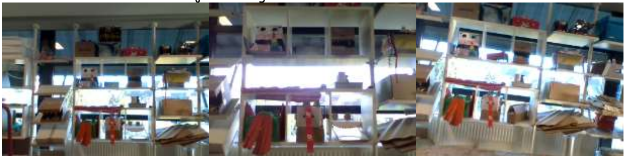
dit zijn bijna alle draken